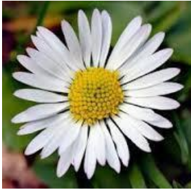
Gruppe max 8 Pers.